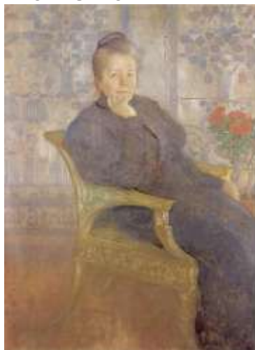
Selma Lagerlöf peinte par Carl Larsson - 1908