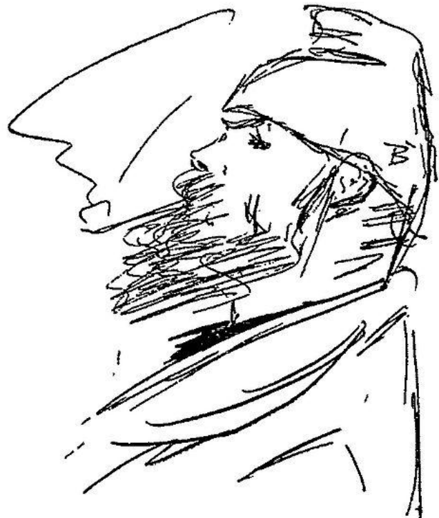
Paul VERLAINE Poète français 1844-1896