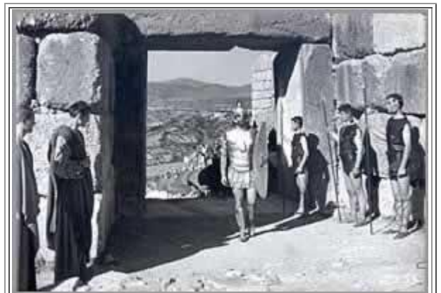
Agamemnon rentre dans sa capitale, Mycènes, et passe sous la «porte des Lionnes» (Electre, M. Cacoyannis, 1961).