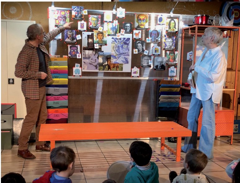
Tableau d'enquête à la fin de la représentation jeune public. Représentation du 12 février 2026 École maternelle libre de Charneux, Belgique