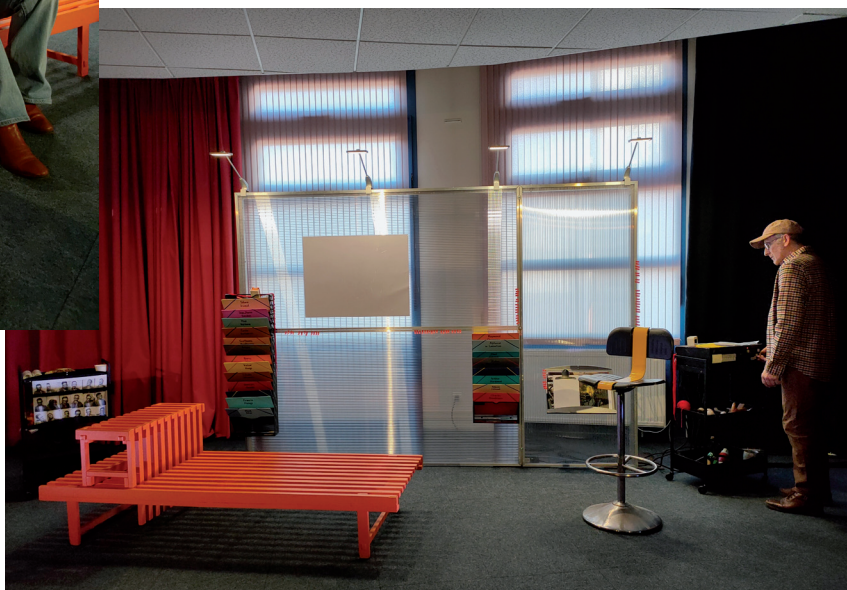
Tableau d'enquête à la fin de la représentation tout public.

Représentation du 29 mars 2025 dans le cadre du Printemps de la poésie Médiathèque Pierre Seghers à St-Pierre-du-Perray.