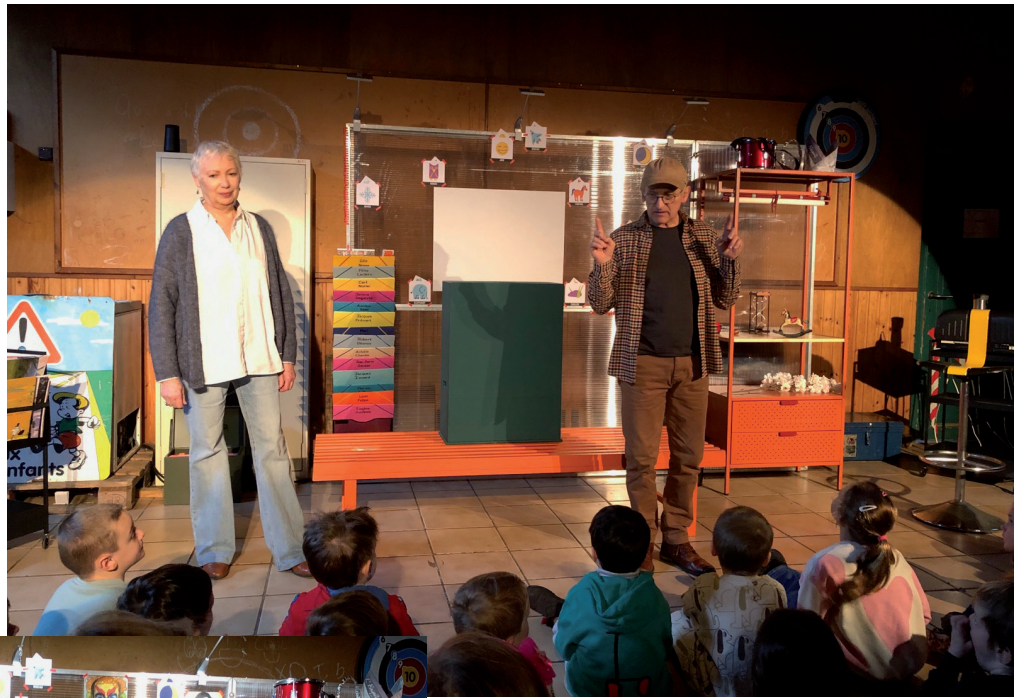
Tableau d'enquête au début de la représentation de la version jeune public.