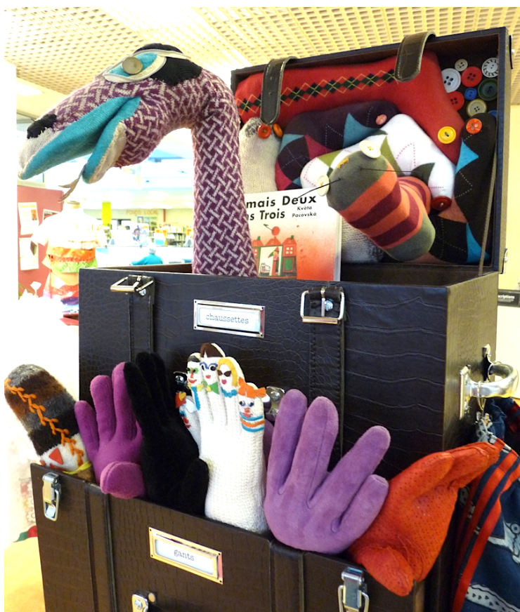
gants & chaussettes