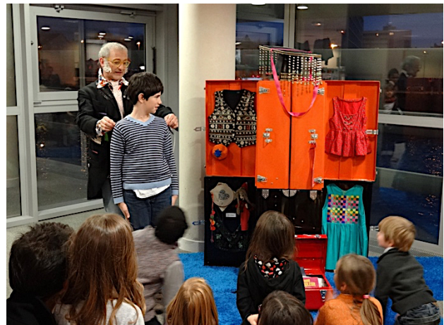
MÉDIATHÈQUE DE L'ASTROLABE – MELUN – Novembre 2012