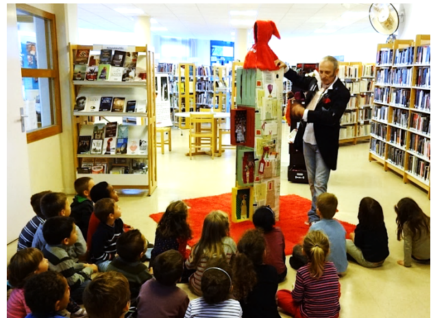
MÉDIATHÈQUE PIERRE SEGHERS – Saint-Pierre-du-Perray – Décembre 2012