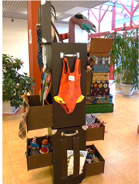
VALISE N°2 les accessoires