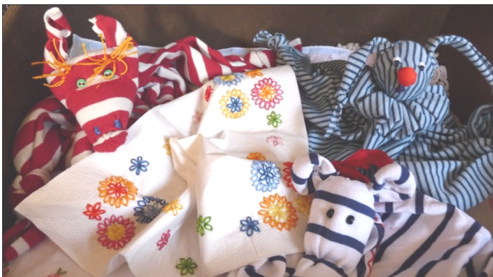
mouchoirs brodés & doudous