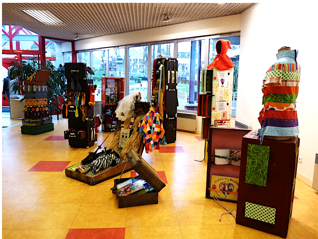
Création de l'exposition à la médiathèque Gérard Billy de Lagny-sur-Marne – Mars 2012

L'exposition est répartie en 7 modules ou « valises » autoportantes pouvant être exposées ensemble ou séparément selon l'espace disponible de la médiathèque.