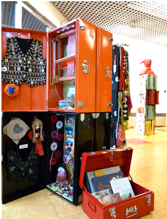
VALISE N°5 les métiers du tissage à la coupe