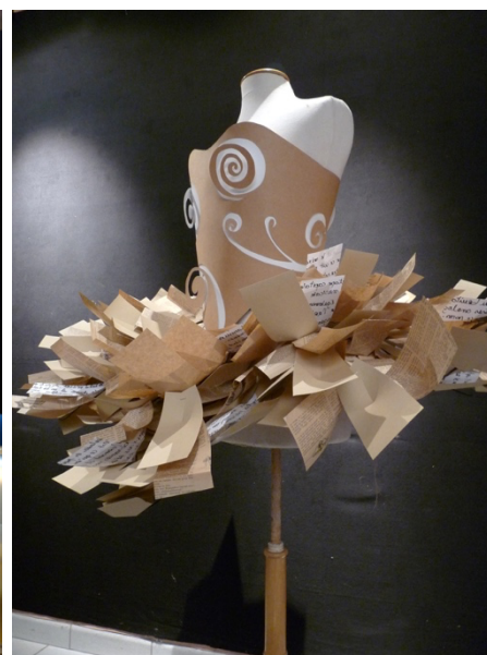
Quelques réalisations des stagiaires exposées au théâtre Charles Vanel de Lagny-sur-Marne – Janvier 2012.