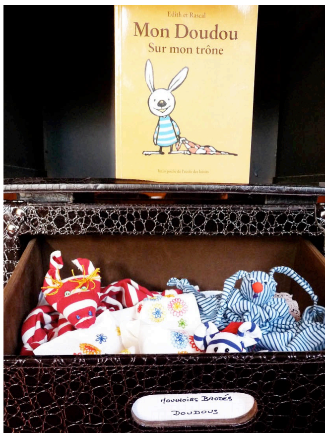
mouchoirs brodés & doudous